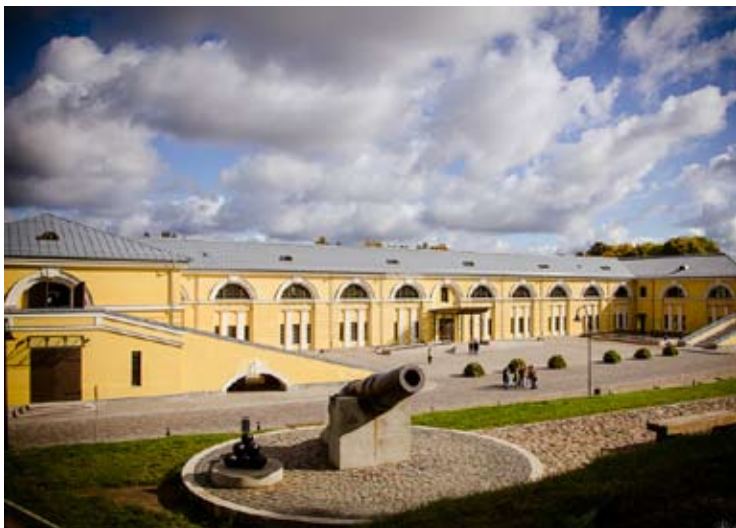
Didžiausia turizmo trauka – Daugpilio tvirtovė ir joje veikiančios ekspozicijos.

Audrė SRĖBALIENĖ LR spec. korespondentė, Latvija