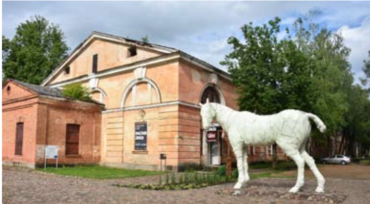
Daugpilio tvirtovės teritorijoje atidaryta dailininkų darbų galerija „Baltais zirgs“.

EUROPEAN UNION European Regional Development Fund