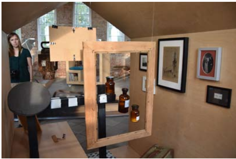
Indroje „Laimės muziejų“ sukūrė menininkai ir vietos bendruomenė.